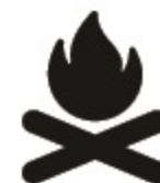
BIJ EEN KAMPVUUR