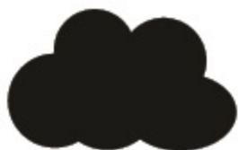
AAN DE BUITENLUCHT